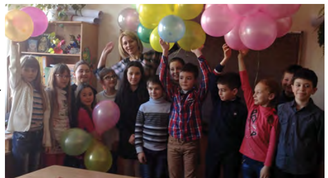
Ваші діти та батьківський комітет 4-А класу

Вітаємо Вас з ювілеєм. Вам 40! Не так уже й багато, Всього лиш 20 тисяч 20. Тож зичимо у це прекрасне свято, Як в юності - міцніти і рости. Ніхто не знає, що нас завтра жде. Зірки, хоч відають, мовчать на видноколі, То ж проживіть усі прекрасні дні По вінця повні у щасливій долі. Нехай Вам легко сходить час робочий Й спокійні будуть вихідні, Хай щастям сяють добрі очі І сонцем радують всі дні. Любимо Вас та міцно обіймаємо.