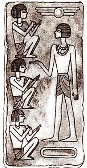
Єгипетська школа. Малюнок на папірусі.

А хто назвав школу школою? Це слово є в усіх слов'янських мовах. У давньогрецькій мові було слово «схоле». Від нього й походить наше «школа», але його значення у греків було іншим: спочатку «затримка», тоді «заняття у вільний час», далі «читання», потім «лекція», нарешті — «школа».