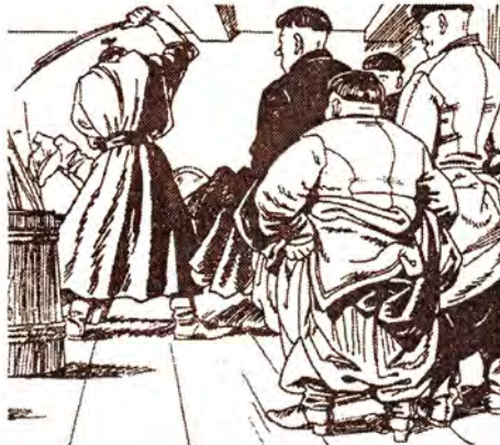
«Будь старанним, хлопчику, інакше будеш битий». В українській школі риторів XVIII століття.

Недавно хтось із київських одинадцятикласників спробував підрахувати, скільки часу за роки навчання довелося провести в стінах рідної школи. Вийшла цифра 460 днів – цілий рік і три місяці. Солідна частка життя для шістнадцятилітньої людини. А якщо додати час, витрачений на виконання домашніх завдань, участь у різних шкільних заходах, то виходить понад два роки... Але чи у всі історичні періоди діти ходили на уроки? Чим стародавня школа відрізнялася від сучасної? Відповідь на ці питання допомогла знайти книга «Календар школяра».