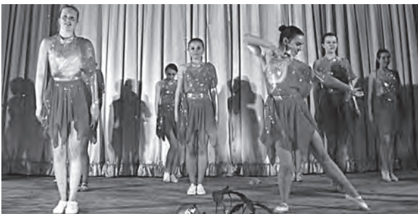
Зірковий склад ансамблю «FREE DANCE»