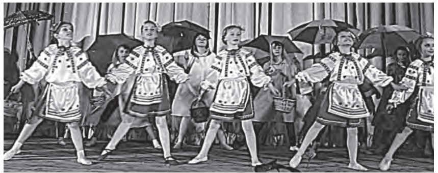
«Каоиний цвіт» у поході «За сунічками»