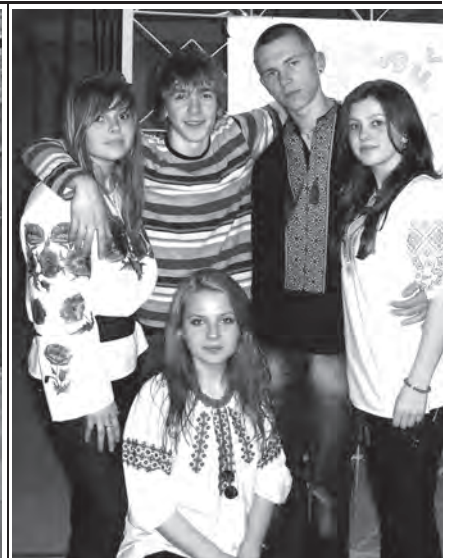
Організатори дискотеки "Слухаємо українське"