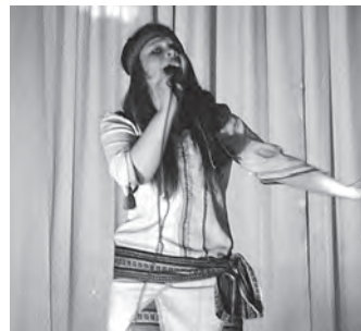
Соломія Гордєєва завжди зачаровує слухачів силою свого голосу