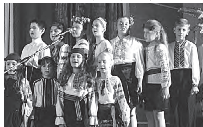
Юні вокалісти "Калинового цвіту"