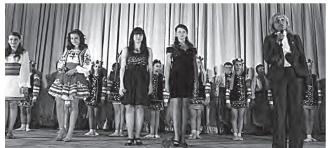
Слова подяки від директора школи