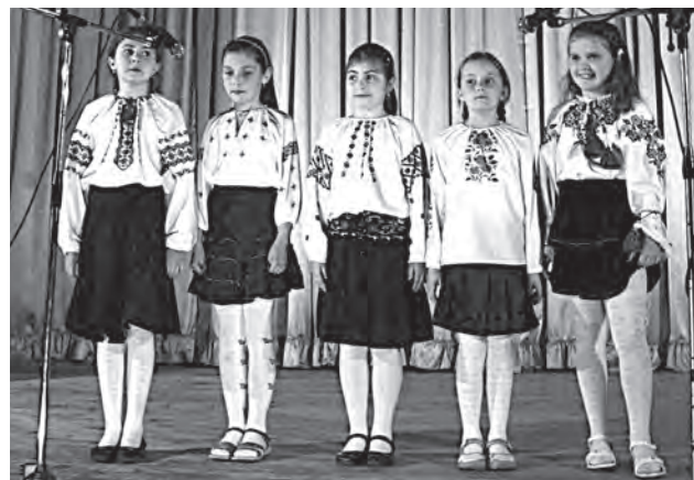
«Шкільна пісня» 3-Б класу