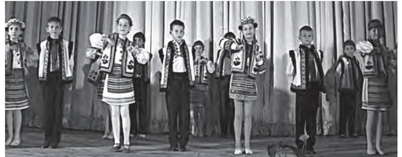
Танцює «Калиновий цвіт» – вокально-хореографічна композиція «Дударик»