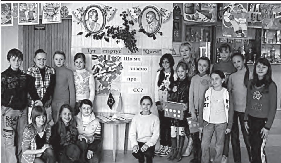
Учасники гри "Quest" - "Що ми знаємо про ЄС?" (організатор - Світлана Тезбір)