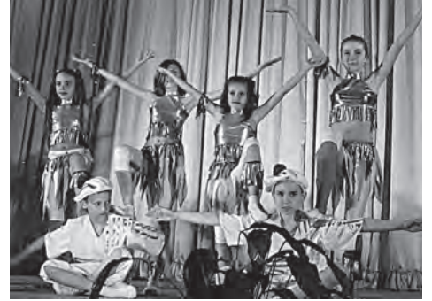
Молодша і середня групи ансамблю сучасного танцю «FREE DANCE»