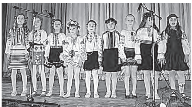
«Весняночка» у виконанні другокласників