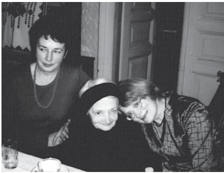
З мамою і сестрою (березень 2004 р.)

І так, і ні. У всі часи дітям властиві були схильність до пустощів, непосидючість, потяг до пригод. Але кожне покоління має, звичайно, свої особливості. Можливо, я помиляюсь, але мені здається, що сьогоднішні учні більше індивідуалісти, що має свої плюси і мінуси, і що їм некомфортно у цьому сьогоднішньому світі, де стерті грані між добром і злом, між дозволеним і недозволеним, де стільки спокус, де немає незастережних авторитетів і т.д., тому вони більше відчайдушні, зухвалі, а інколи навіть агресивні.