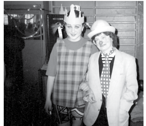
«Ах карнавал-карнавал» (2000 р.)

Народження онука – це невимовно велика радість для мене. Намагаюся пригадати зараз усі колискові, дитячі пісеньки, примовлянки й забавлянки, які я колись знала, і мрію про ту мить, коли зможу взяти його за ручку і повести на прогулянку чи розповісти цікаву казку, відкриваючи разом з ним (і для себе заново) світ добра та краси.