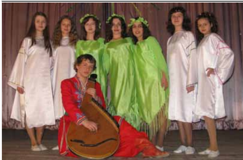
Актори шкільного театру "Зорина" в інсценізації уривка з повісті Миколи Гоголя "Майська ніч"... (детальніше про міський конкурс на краєц театральну постановку творів М.Гоголя читайте у наступному номері газети).

«Ранетки» популярніші за Білана і Путіна! 10 грудня 2008 року вони отримали статус найпопулярніших публічних людей Росії за версією компанії Google, яка опублікувала щорічні рейтинги запитів Zeitgeist. Перше місце в числі найпопулярніших публічних людей посіли «Ранетки», у почесній першій трійці разом з ними опинилися Діма Білан - на другому та Володимир Путін - на третьому.