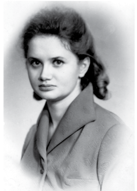
Випускниця педінституту (1975 р.)

5. Нещодавно донечка Іванка подарувала Вам нове звання – «бабуся». Як почуваетесь у новому для себе статусі?