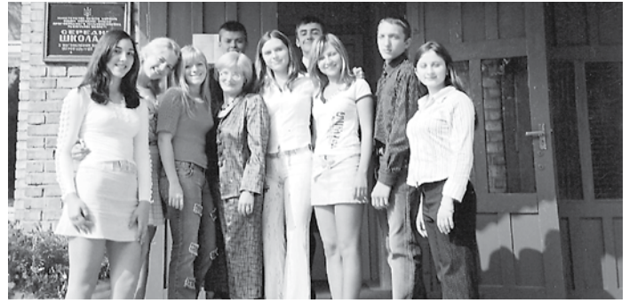
З випускниками 2006 року

А ще бажаю віднайти в житті істинні цінності, реалізувати всі свої потенційні можливості, жити яскравим насиченим життям, бо тільки зароблений в поті чола хліб не проїдається. Не задріть тим, хто має все. Повірте, їм дуже нудно жити на цьому світі. А ще бажаю, щоб завжди поруч з вами були рідні й близькі вам люди, справжні і вірні друзі.